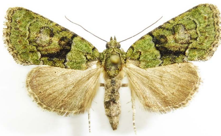
Fig. 2. Cryphia algae from Ylakiai.